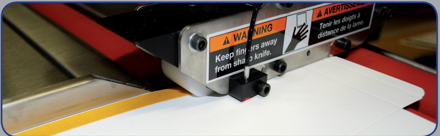
MAXIMALE PRÄZISION BEIM AUFBRINGEN VON DOPPELSEITIGEM KLEBEBAND