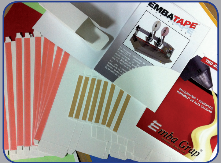
DIE LÖSUNG FÜR VIELE KARTONKONFEKTIONIERUNGEN